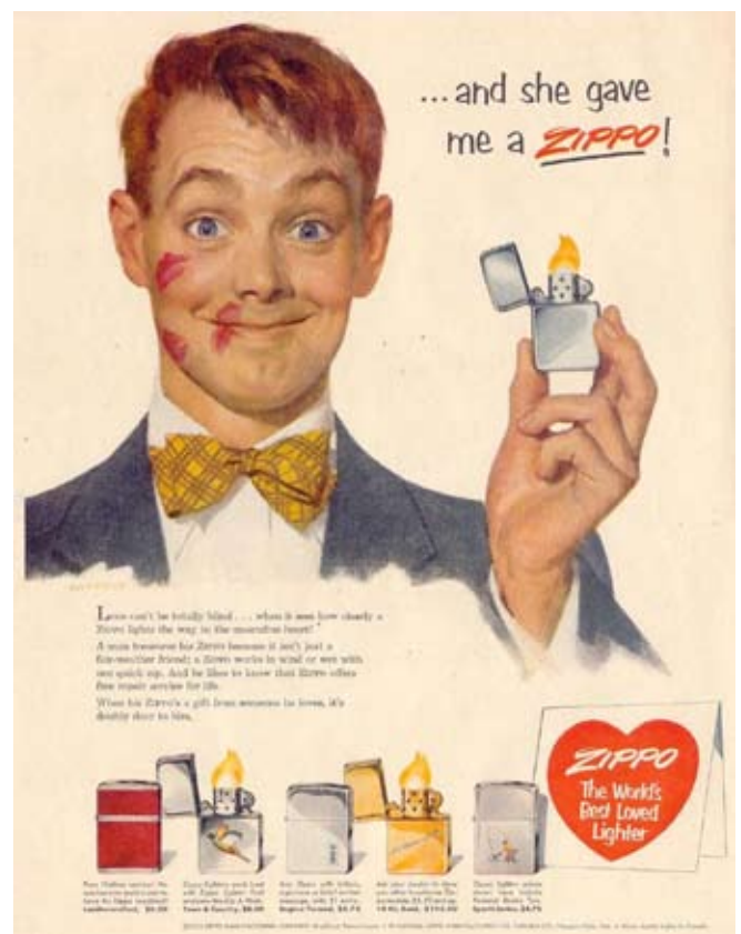
Anunci de la marca Zippo de l'any 1953