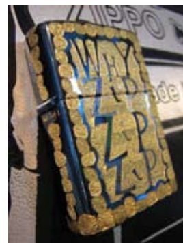
Zippo gravat pel mestre Paul Fleming