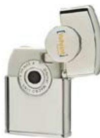
Model Zippo Càmera

Finalment, volem dir-vos que fa poc que Zippo ha obert un espai en què fins i tot ens podem dissenyar el nostre propi encenedor o fer-ne un model especial per regalar de manera personalitzada, http://www.zippo.com/customize/ , i només des de 9,95 $.