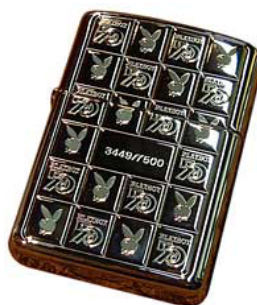
Model Zippo per commemorar el 50 aniversari de Playboy