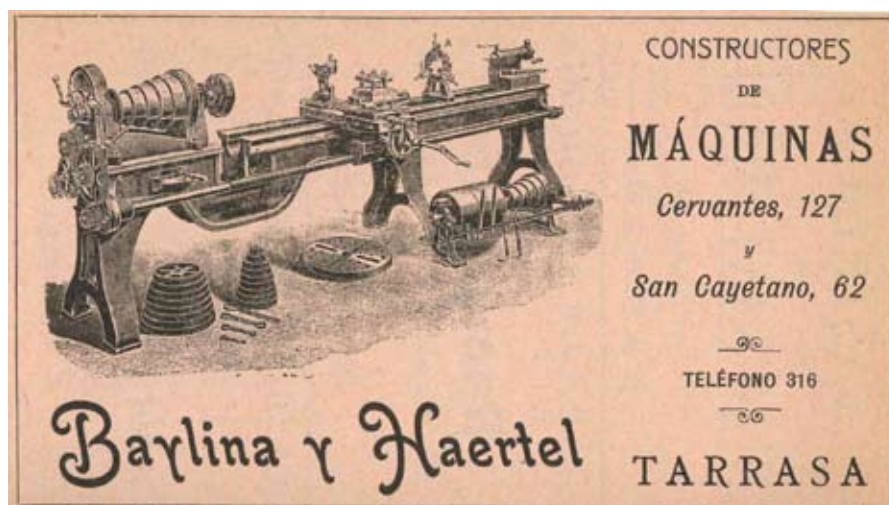
Anunci publicat a la Guia de Tarrasa, Llofriu y Castarlenas de l'any 1907

Des de l'Associació Grup Filatèlic, Numismàtic i de Col·leccionisme de Terrassa volem aportar, amb sinergia amb les altres entitats col·laboradores, no només esperit col·leccionista i cultural sinó valor afegit que mantingui l'ànima atenta i viva avui i ara que bé ho necessitem.