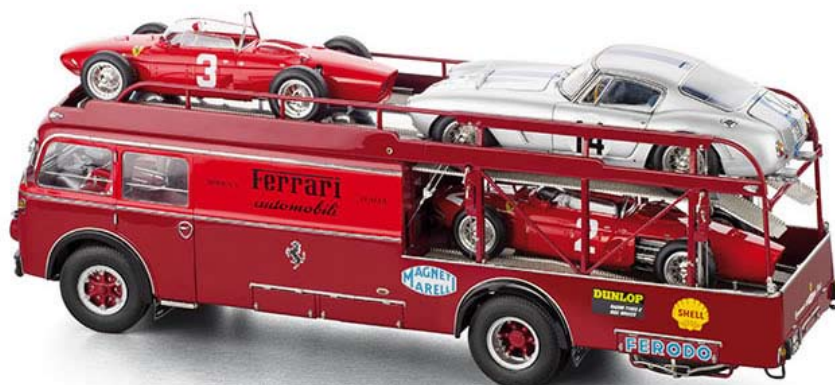
Camió oficial de Ferrari de 1957, amb tres models Ferrari de l'època.

Finalitzarem aquest recorregut visitant el web d'un museu dedicat a les miniatures de cotxes, http://www.museuminiaturaautomovel.com/ , situat a Gouveia, una ciutat de Portugal. A http://vintagedriving.com/marvins-miniature-car-museum/ podreu veure un vídeo del Museu Marvins sobre miniatures de cotxes.