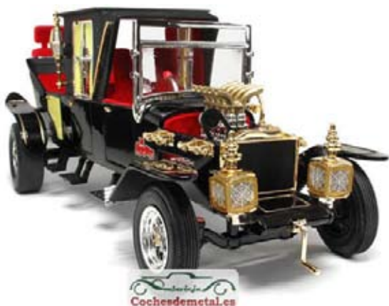
Miniatura del cotxe de la Família Monster

Hi ha col·leccionistes de miniatures de cotxes d'època, però també n'hi ha d'especialitzats en vehicles militars i, per a aquests, us recomano el web: http://www.diecast.es/ . I per a aquells a qui agradin les miniatures de vehicles industrials o agrícoles els caldrà visitar http://www.minimaquinas.com/