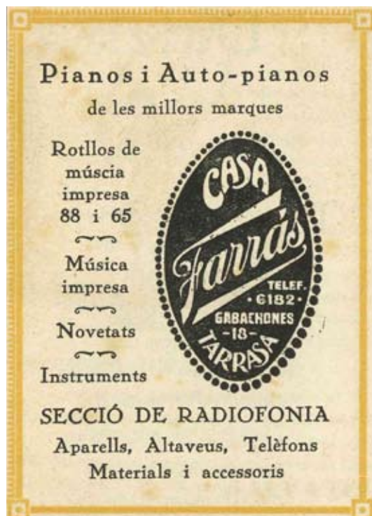
Anunci publicat a Llum Novella núm. 1 d'abril de 1925

Ens plaurà poder seguir desenvolupant les activitats socials pròpies, que ens entretenen i alhora ens permeten aprendre. Ens suposa sovint un esforç afegit, un esforç que ens rejoveneix i ens manté la il·lusió, que ens ocupa el pensament i hores a la seu social, on ens hem de trobar acollits i hem de ser acollidors, responsables de tota la gestió de l'Associació, creatius en un món complex, el de l'associacionisme, i, més en un món on s'escurcen els recursos econòmics, hem de tenir esperit participatiu. Tots som l'Associació i hem de preguntar-nos què hi podem aportar individualment i no pas què en podem treure. Amb aquest esperit, la Junta us desitja un bon any.