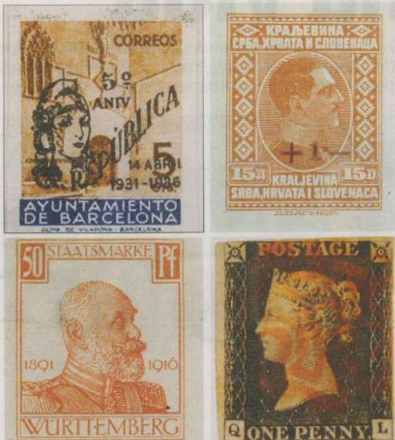
Segells de tot el món integren la col·lecció Marull. A baix a la dreta, un 'Penny black'.

El desig del mecenes, que abans havia rebutjat avantatjoses i temptado-