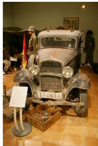
cotxe guerra civil - la trinxera

I finalitzarem el recorregut internacional amb una visita al web Alba – Abraham Lincoln Brigade Archives, http://www.alba-valb.org/ , d'una fundació fundada l'any 1975, centrada en la preservació i difusió de la història del paper nord-americà en la Guerra Civil espanyola, i que conserva un gran arxiu de la Biblioteca Tamiment de la Universitat de Nova York. Destaquem tres exhibicions itinerants: Shouts from the Wall , una col·lecció de pòsters de la guerra, The Aura of the Cause , una exhibició de fotos fetes pels brigadistes americans, i They Still Draw Pictures , una col·lecció de dibuixos fets per nens republicans a l'exili.