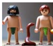
Adan i Eva

I finalitzarem aquest recorregut de nou a Alemanya, visitant la primera web que es va fer dedicada al món dels Playmobils http://www.gardenwargaming.com/ amb una temàtica exclusivament militar.