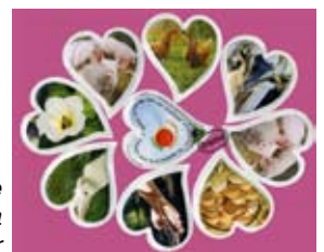
sobrets de sucre forma de cor