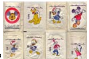
sobrets de sucre anys 60