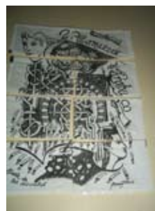
sobrets de sucre puzzle

Espero que aquest recorregut us hagi resultat prou dolç.